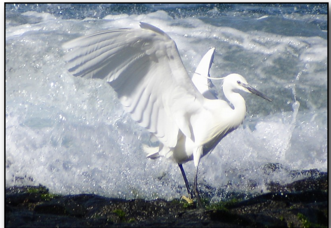
Foto 1. Garceta común ( Egretta garzetta). Según la Propuesta de CC este hermoso animal y muchos otros carecerían de cualquier protección en Canarias fuera de un Espacio Protegido por el hecho de tratarse de una especie DE INTERÉS PARA LOS ECOSISTEMAS CANARIOS.