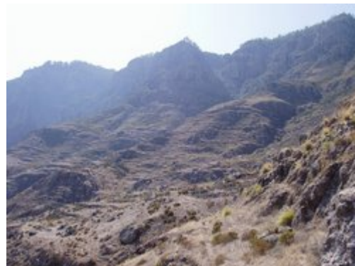
Llano de Berbique