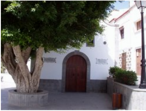
Ermita de San Pedro.