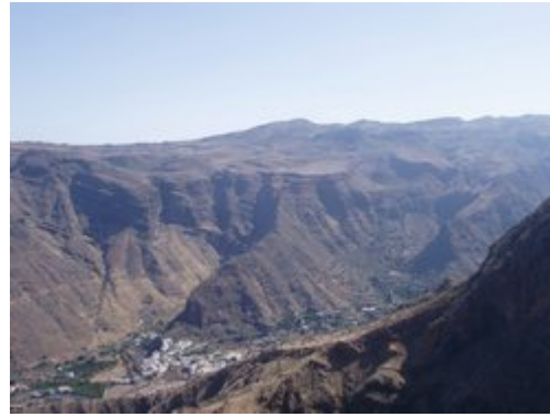
Vista parcial de Valle de Agaete.