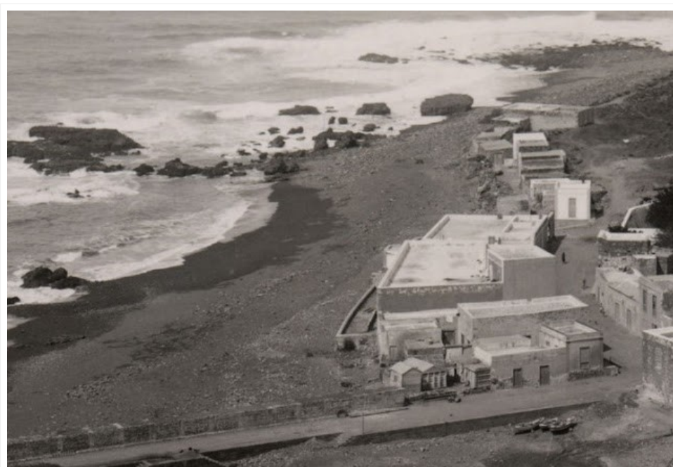
Las Nieves años veinte del pasado siglo, casitas de pescadores.

Desde el principio me di cuenta de que había algo extraño. Desde luego interrogué a los pescadores sobre lo que habían visto..."