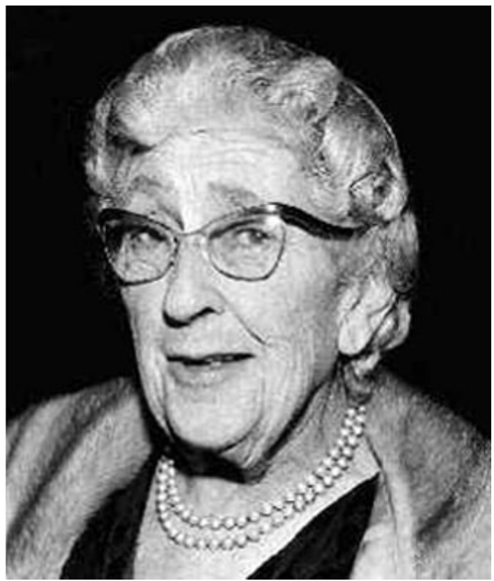
A la izquierda, Agatha Christie con su tabla de surf en los años 20. A la derecha, la escritora en su madurez.