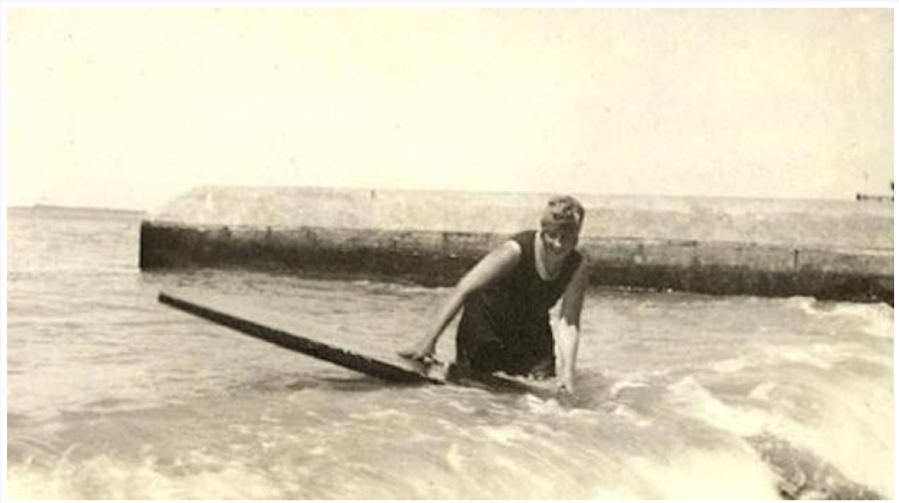
Agatha practicando surf en su juventud en alguna playa probablemente Sudáfrica o Hawái.

Sobre el mes de febrero de 1927, la reina del delito, la escritora inglesa Agatha Christie, llegó a Las Palmas después de pasar unos días en Tenerife, buscando playas y buen clima que no encontró en la isla de enfrente, al parecer para relajarse de los problemas que le había ocasionada su reciente divorcio, escribir, practicar surf y el baño, así describía el Puerto de la Cruz en su autobiografía: