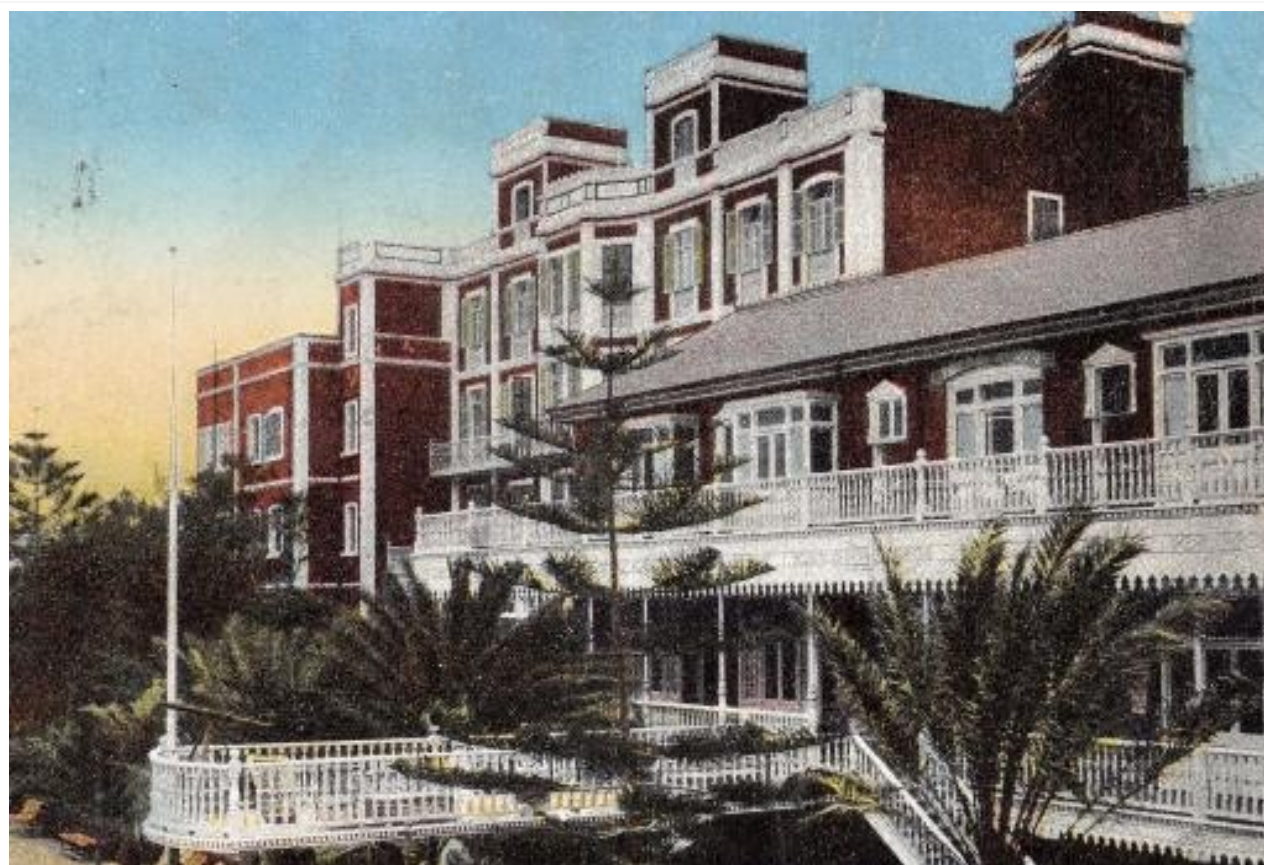
Hotel Metropol, Las Palmas años veinte del siglo pasado.

En Gran Canaria además de nuestras hermosas playas se encontró con un mejor clima que en el Puerto de la Cruz (según ella), una amplia colonia inglesa con sus exclusivos clubs, lo que le hacía parecer que estaba en su Inglaterra natal. Se alojó en el antiguo hotel Metropol.