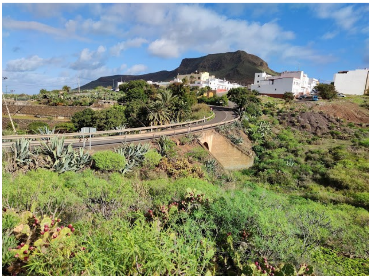
El lugar del accidente en la actualidad.

Cuando los familiares y amigos de los accidentados en Agaete fueron teniendo conocimiento corrieron todos al lugar, desarrollándose escenas muy dolorosas.