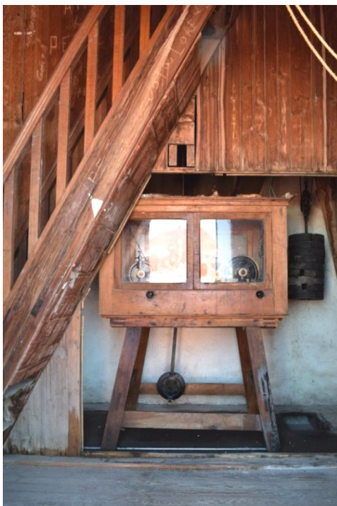
Armario de madera que guarnece el centenario reloj y el caballete de cuatro patas donde descansa la maquinaria. Su estado de conservación es aceptable. Fotografía del autor, 2019