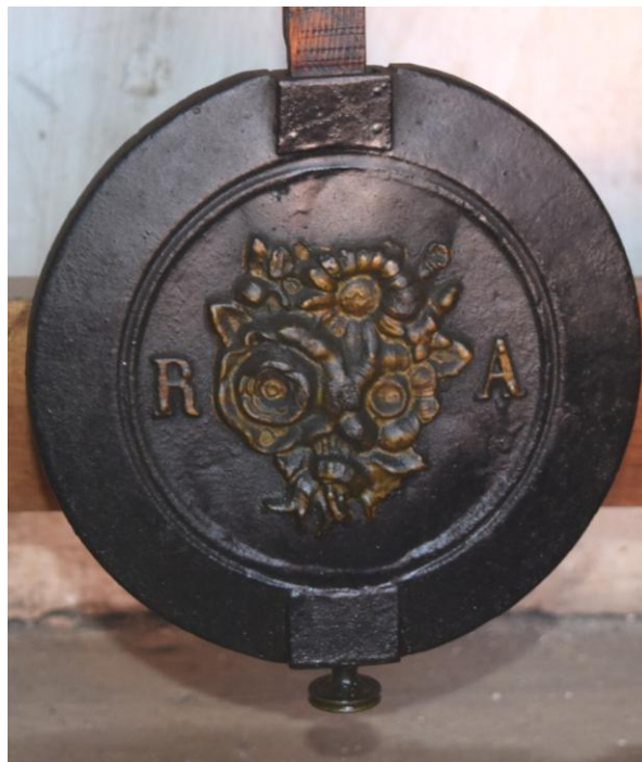
Lente de Avance y Retroceso , con ramillete de flores característico del autor del reloj de Agaete.